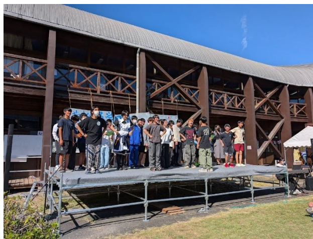
「スマイル」のリハーサル