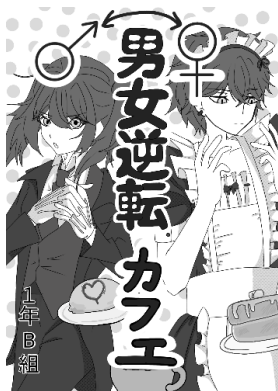
学園祭準備の様子